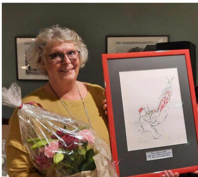
Judith Vestrheim med Folkemusikkprisen for 2020.

http://www.folkemusikklaget.no/folkemusikkprisen.160292.no.html